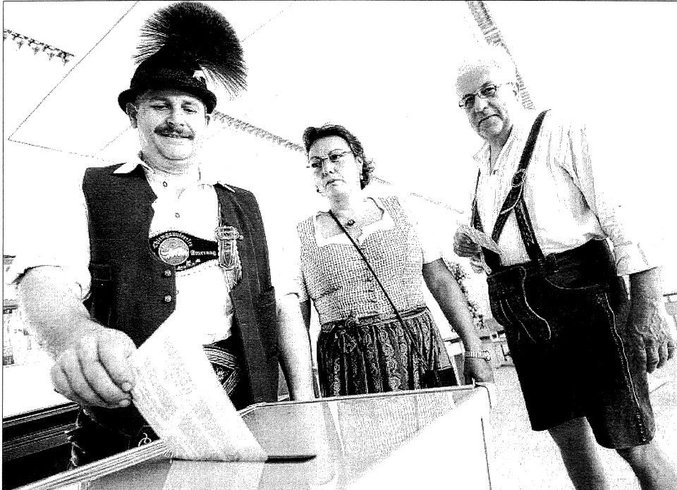
WELCHE MOTIVE FÜHREN ZUR STIMMVERGABE?: Eine Studie am Karlsruher Institut für Technologie hat dieses Thema beleuchtet. Demnach entscheiden die Wähler aufgrund von überkommenen politischen Bindungen und lassen sich vom persönlichen Image der Politiker beeinflussen.